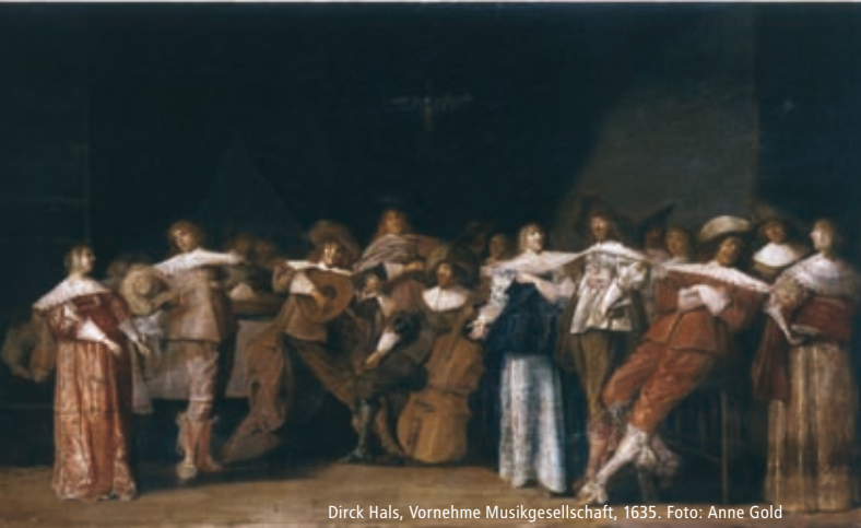
Dirck Hals, Vornehme Musikgesellschaft, 1635.

BIS ENDE AUGUST IN DER SPARKASSE AM MÜNSTERPLATZ