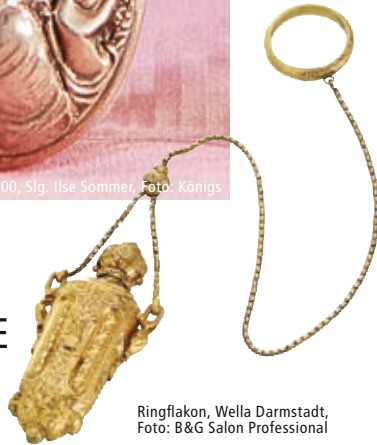
Ringflakon, Wella Darmstadt

Die Ausstellung im Couven-Museum unternimmt einen Streifzug durch die Geschichte verführerischer Schönheitsmittel von der Antike bis zur Gegenwart. In Kooperation mit Babor Cosmetics als internationalem Aachener Traditionsunternehmen werden ausgesuchte Objekte und Gemälde zur Kultur der Schönheitspflege gezeigt und dabei auch ein Einblick in die schnelllebigen und doch so charakteristischen Trends der modischen Schönheit und ihrer Pflege von den 50er Jahren bis heute geboten.