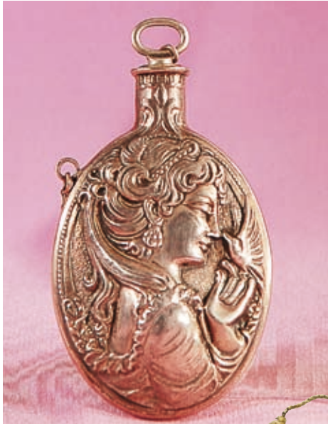
Flakon mit Silberkettchen, nach 1900, Slg. Ilse Sommer